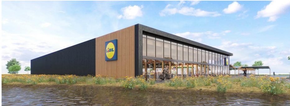
impressie Lidl Zero – nu in aanbouw

In de rug van DemoParkNL bevindt zich het 4300 hectare grootte woonlandschap Oosterwold. Een inspirerende woonomgeving die organisch en zelfvoorzienend ontstaat. Ook wel als de kraamkamer van innovatieve woningbouw in Nederland beschouwd.